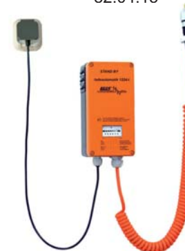
Stand By Ladeautomatik 1224-I mit Spiralleitung