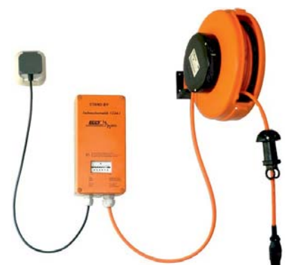
Stand By Ladeautomatik 1224-I mit Leitungsaufroller 12 m

verschiedene Größen und Steckerkombinationen sind unter 4.4.2 aufgeführt